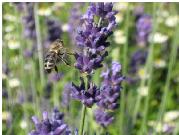
Abeja que recoge néctar y polen de la flor de lavanda

La presencia de pesticidas neurotóxicos en sus alimentos y agua de bebida afecta a todas las abejas en la colonia. Así como la toxicidad directa para las abejas y la cría, las concentraciones subletales de los plaguicidas actuales afectan a su sistema nervioso alterando su memoria y capacidad de aprendizaje, disminuyendo su sensibilidad a los estímulos dificultando la comunicación, y dañando su sentido de orientación. A modo de comparación, los efectos sobre la abeja son similares a los efectos del alcohol en los seres humanos. Afecta la forma en que la colonia puede defenderse de otros factores dañinos.