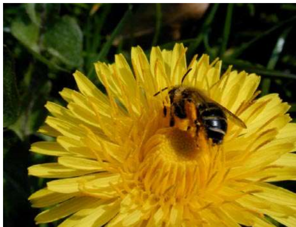
Alimentación de abejas en un diente de león

La Coordinadora Europea Apicultura pide a la Comisión Europea que garantice un marco en el que las abejas y otros insectos beneficiosos, junto con la actividad apícola, puede convivir con la agricultura.