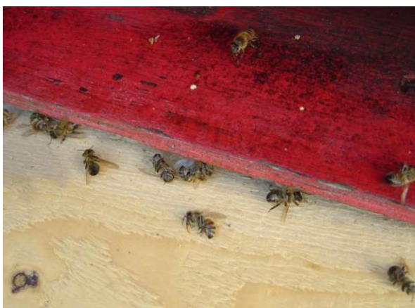
Observación de la colmena a primera hora de la mañana : abejas muertas delante de la entrada de la colmena

Los insectos que se alimentan del polen, néctar o de la planta directamente, se exponen a ellos de forma continuada o crónica, ya que permanecen en la planta durante largos períodos de tiempo. Igualmente ocurre con el agua contaminada de plaguicidas que intoxica a las abejas cada vez que la beben. Incluso si las concentraciones no las matan al instante, la exposición repetida a pequeñas cantidades de plaguicidas puede tener serios impactos en la salud de las abejas.