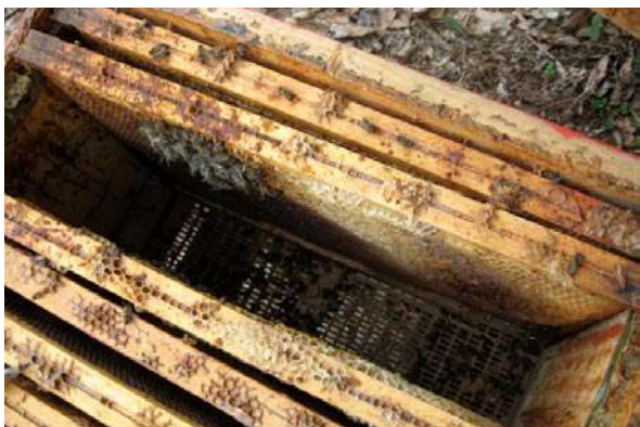
Colmena que presumiblemente está afectada por el Síndrome del colapso de las colmenas : las abejas han desaparecido, muy poca cantidad de abejas en una colmena que se no muestra ningún problema antes del invierno.