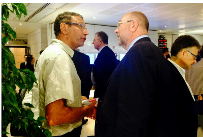
Frank Aletru, président du SNA et Stéphane Travert, Ministre de l'agriculture et de l'alimentation (EGA, Paris, le 20/07/2017)

La sécurité alimentaire nous préoccupe et nous restons vigilants face aux contaminations chimiques des produits de la ruche : cire et miel, par exemple. Comment prévenir les contaminations pour éviter de se retrouver avec des produits impropres à la consommation 1 ? Quels outils mettre en œuvre pour les limiter ? Voilà deux questions auxquelles nous aimerions tenter de répondre ( Atelier 8 ).