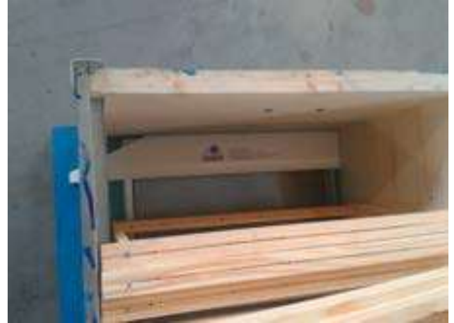
Figure 4 - Positionnement sur le plateau de la ruche Dadant

Il est essentiel que la bande repose directement sur le plateau de la ruche et ne soit pas retenue en l'air par des débris tels que les abeilles mortes. Sinon les coléoptères se cacheront sous la bande au lieu d'aller à l'intérieur de la bande et ne se feront pas piéger.