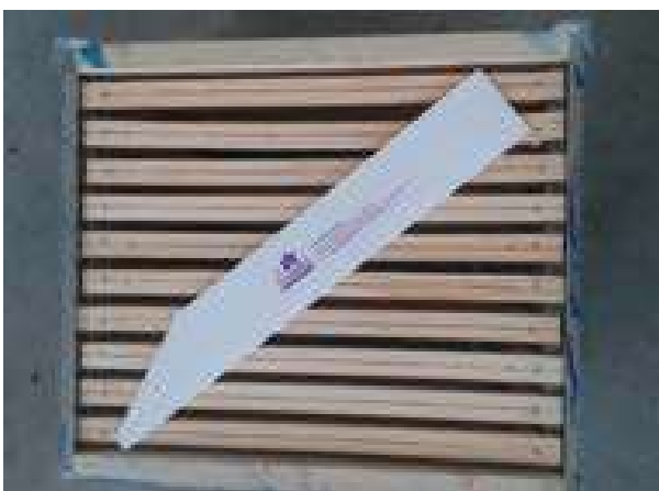
Figure 5 - Positionnement d'une bande de dépistage au-dessus des cadres

Les bandes ne peuvent pas être utilisées sur le plateau de la ruche lorsque les températures sont inférieures à 20 ° C, car dans ces conditions, les coléoptères fréquentent les parties supérieures plus chaudes. Dans ce cas, il est préférable d'installer les bandes au-dessus des cadres (fig. 5) ou d'utiliser d'autres modèles de pièges suspendus entre les cadres.