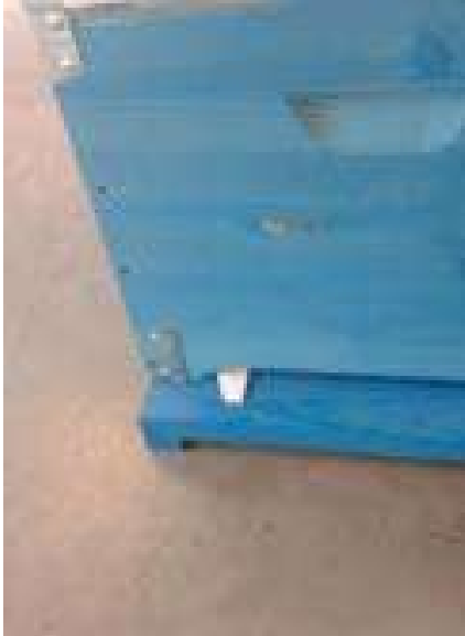
Figure 3 - Extrémité de la bande de dépistage apparaissant au trou de vol d'une ruche Dadant

Les bandes doivent être placées sur un côté du plateau et introduit dans la ruche par le trou de vol.