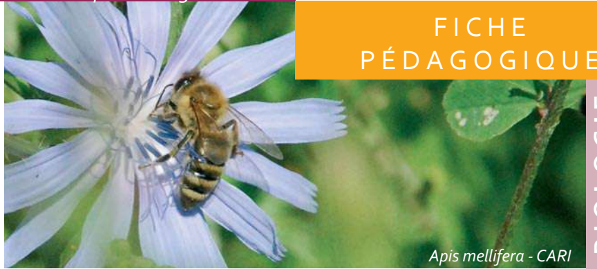
Apis mellifera - CARI

On les appelle familièrement « abeilles des sables » en référence à leurs sites de nidification, des terrains sablon-